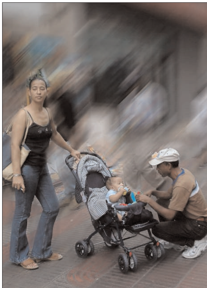
EL CÓDIGO DEBE INCLUIR EN SUS ENMIENDAS LA PROTECCIÓN SOCIAL.

En el contenido de Hacia un código de familia se incluyen entrevistas a expertos en las ramas de género y salud reproductiva, legislación nacional y sistema de salud nacional, con la finalidad de proponer el consenso como elemento esencial del código.