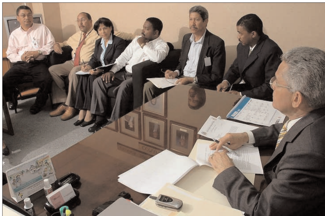
LAS REUNIONES SEMANALES DE LA DIRECCIÓN EJECUTIVA DE CONAPOFA MOTORIZAN LAS ESTRATEGIAS DE ACCIÓN.

Durante los primeros 365 días de ejecución del Plan Estratégico 2005-2009 del Consejo Nacional de Población y Familia fueron conquistadas 19 metas que permiten avances en la planificación demográfica y de la familia de la República Dominicana.